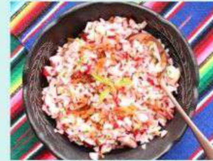
1. SALADE DE RADIS