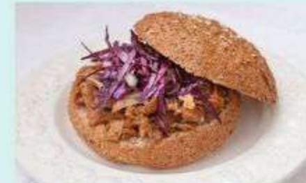
3. BURGER DE PORC KALUA