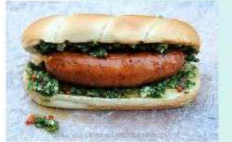
4. HOT DOG CHORIPAN