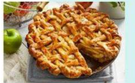
5. APPEL PIE